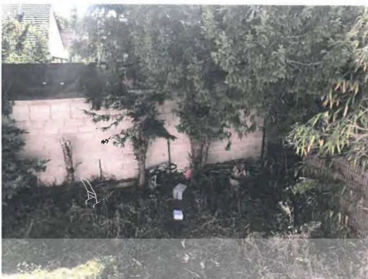
Vues extérieures prises depuis l'intérieur du pavillon :